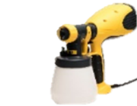
(Elektrisch - Wagner W100)

Luxe kleuren: € 53,60 / st - (5L verpakking)